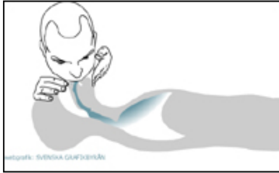
(فوو پیا دا كړدن)

3- به دوو په نجه كوڼه لوتی نه خوښ بگره ، هاوكات هه ناسه يه كی قول وهر بگره و لیوت بنوسینه به لیوی نه خوښه وه و به هیزی خوت فوو بگره نیو دم و سنگی نه خوښه وه .