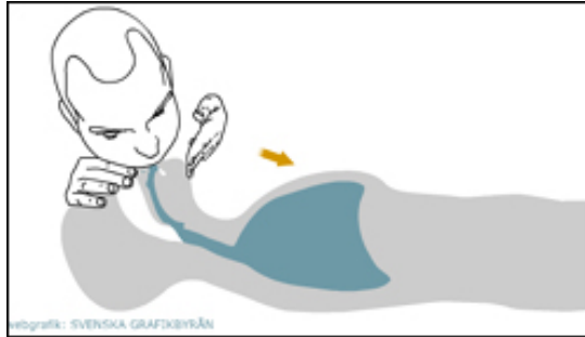
(پاش فوو پیا كړدن به تیله ی چاو سهیری سنگی نه خوښ بكه)

4- دم به رز بگره وه ، بروانه نایا قهفه زه ی سنگ به رز ونزم ده بیته وه و له کاتی هه ناسه دانه وه دا هه مان كړدار دوو باره و سی باره بگره وه .