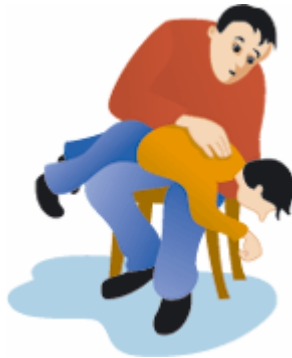
(له کاتی خنکاندنې مندالدا)

– گهر منداله که زور گچکه بو ټولو توند هه ردو و قوله پیی بگرو سهره و خوارې بکهره وه به له پی ده ست بکیشه (زور به هیژ پیایدا مه کیشه) به نیوان ده فیهی شانیدا (پشت) .