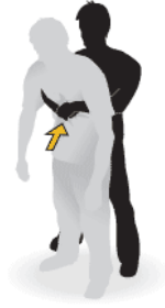
(له کاتی خنکاندنې گوره دا)

3- گهر 3 جاران ټولو دوو کرداره ټولجا می نه دا به دسته وه ټولو پیویسته به زووترین کات نه خوښ بگهیه نریته به شی فریاگوزاری ، گهر نه خوښ بیهوش بو ټولو هه ناسه دانی دستکردی بو ټولجا بده .