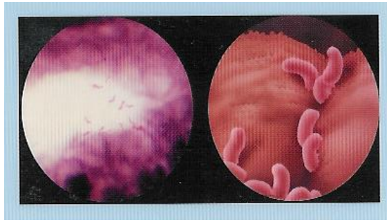
(ھیلیکۆباکتیر پیلوری Helicobacter Pylori)

یەکیکە لەو نەخۆشییە ناسراوە بلوانە ی کەم یان زۆر دانیشتوانی میللەتانی دنیای گۆتۆتەو و بە ریژە ی جیاواز دەبینریت و لە کوردستانی خۆشماندا گەلیک کەس بە دەست ئەم نەخۆشییەو دەنالین و زیڈەتر زاراوە ی عارەبییەکە ی (قورحە) ی بۆ بەکار دەھێریت . زۆر پسیۆر نەخۆشییەکە بە نەخۆشی کۆمەل ناو دەبەن . پێش دۆزینەو ی باکتریاکە نەخۆشییەکە تولانی بوو و زۆرجاران سەری ھەلەدەدایەو و نەخۆشی وەرپس دەکرد وەلی لە سەرەتای سالانی ھەشتاکاندا ئاماژە بەو راستییە کراوە کە بەکتریای ھیلیکۆباکتیر دەبیته ھۆی برینی سەرنیۆپۆشی گەدەو ریخۆلە .