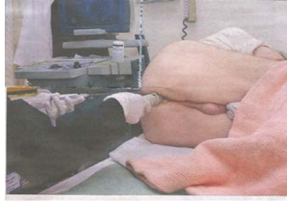
(سۆنۈگرافى ، سەرچاۋەى ژ 9)

– كۆتۈرۈلگۈدنى نە خۇش بە سۆنۈگرافى يارمەتى دەرى دەستىنىشائىكردنەكەيە .